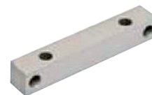
SÉRIE T EQUERRE DE FIXATION